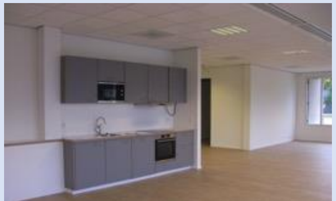
Regiocentrum Gooi en Vecht huiskamer

In Hilversum werd, ook voor Stichting De Bascule , een cascoruimte van \pm 420 \text{ m}^2 verbouwd tot Regiocentrum.