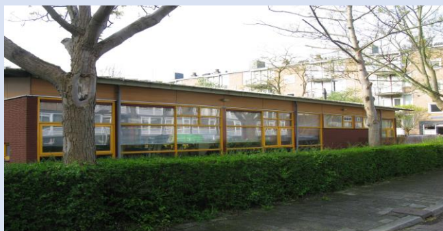
Van Kinschotstraat, Delft gevelonderhoud

Camerling Beheer b.v. gaf opdracht voor de voorbereiding en uitvoeringsbegeleiding van het gevelonderhoud van Fysiotherapiepraktijk De HoornseHof . Een aantal van u zal de foto's herkennen: het is het voormalige kantoor van Spatia architecten voorheen Kok & de Haan architecten.