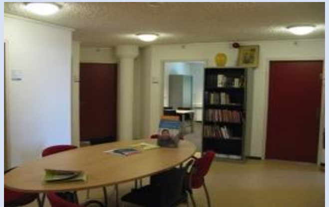
Wachruimte Kliniek Duivendrecht

Voor Stichting De Bascule werd in Duivendrecht een deel van de 3 e verdieping opnieuw en efficiënter ingericht. Daardoor ontstond ook de gewenste wachruimte.