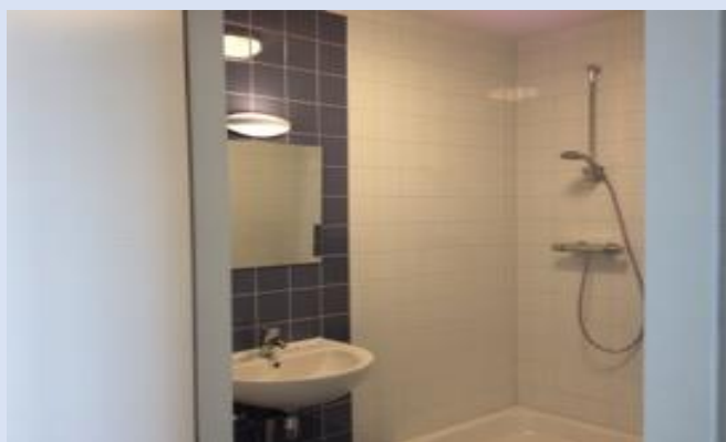
Atalanta, Moordrecht vernieuwde badkamers