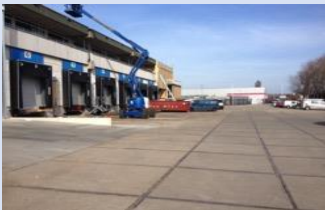
Distributie Centrum Monst dock's voorzijde

Voor PéHa Vastgoed Nove b.v. voerde ik sinds 2006 het technisch beheer van het Distributie Centrum in Monst, ontworpen door L.P. van der Gaag. Inmiddels wordt het gebouw verbouwd om dienst te doen als expeditiehal voor Kubo Greenhouse Projects; één van de grootste kassenbouwers ter wereld.