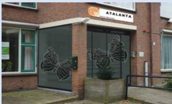
Atalanta, Moordrecht entree

In Moordrecht is in opdracht van Gemiva-SVG Groep een deel ( \pm 800 \text{ m}^2 ) van het wooncentrum voor ouderen verbouwd tot woon- en logeerlocatie Atalanta. Er wonen nu 17 jongeren met een (licht)verstandelijke beperking. In Atalanta zijn tevens gemeenschappelijke huiskamers en keukens gerealiseerd. Project in samenwerking met Atelier Space en Peelen Interieur B.V.