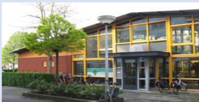
Fysiotherapiepraktijk HoornseHof entree

Gelijktijdig met de gevelonderhoudswerkzaamheden adviseerde ik fysiotherapiepraktijk De HoornseHof (de nieuwe huurder) bij de inrichting (met name nieuwe sanitaire installaties) in hun nieuwe praktijk.